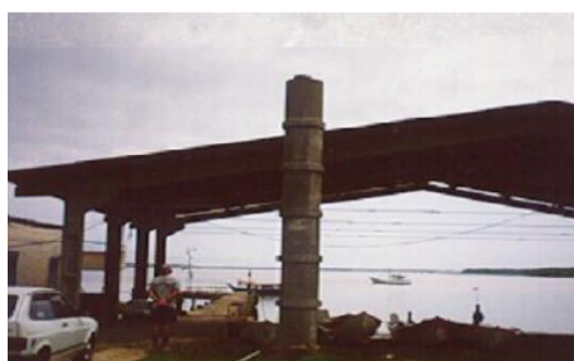
Antena e pilar