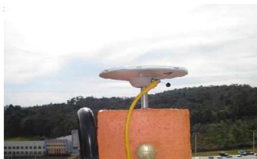
Antena e pilar