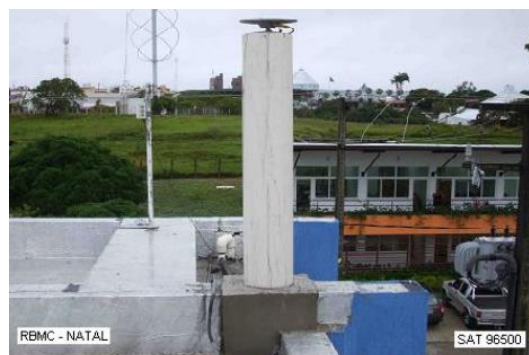
Antena e pilar