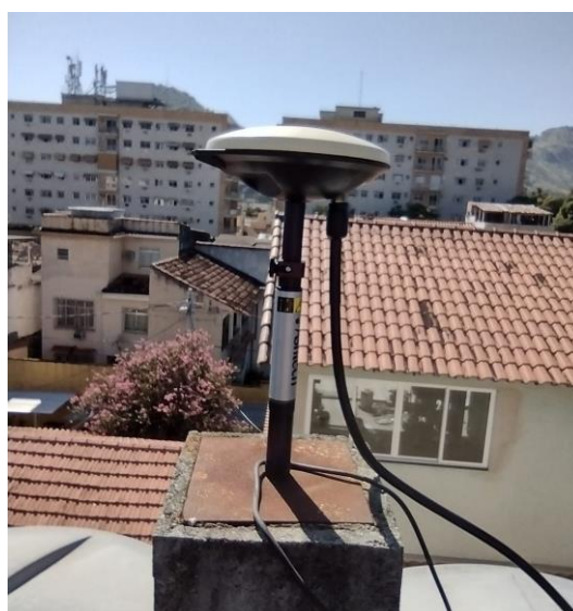
Antena e pilar