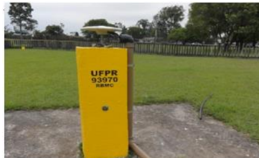
Antena e pilar