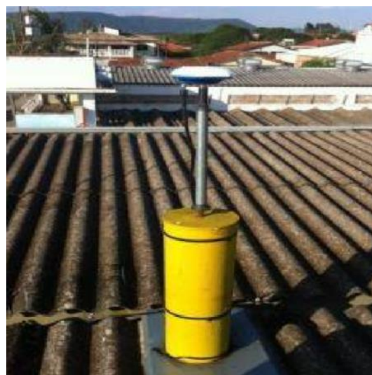
Antena e pilar