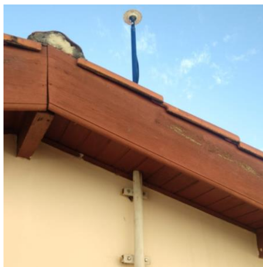
Antena e pilar