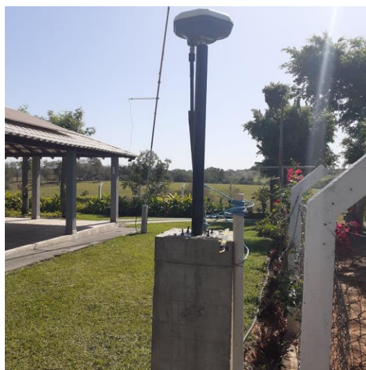
Antena e pilar