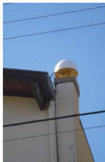
Antena e pilar