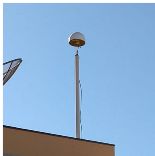
Antena e pilar