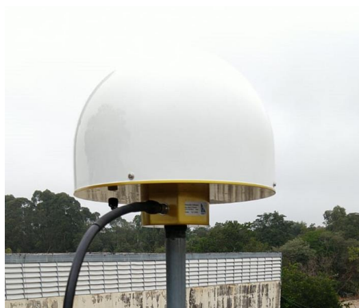
Antena e pilar