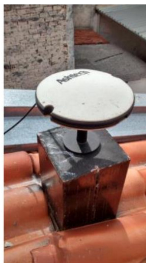
Antena e pilar