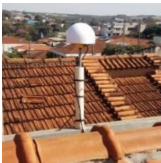
Antena e pilar