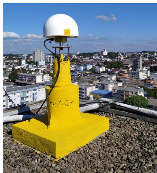
Antena e pilar