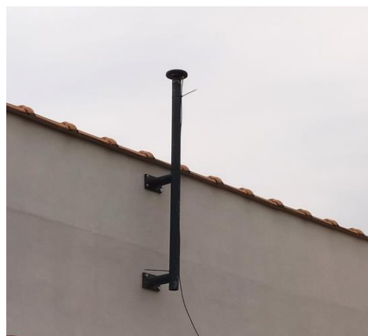
Antena e pilar