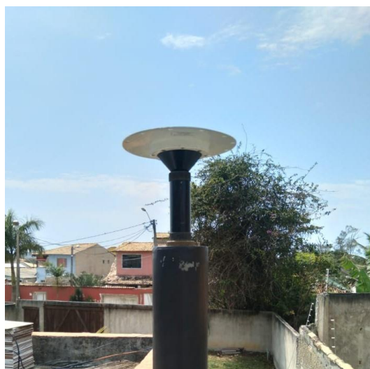
Antena e pilar