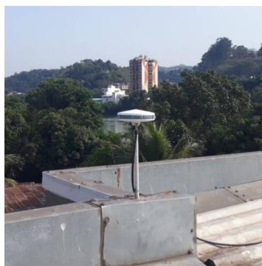
Antena e pilar