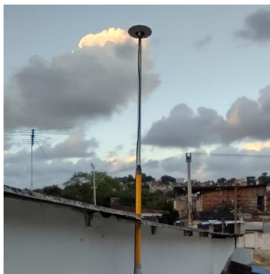
Antena e pilar