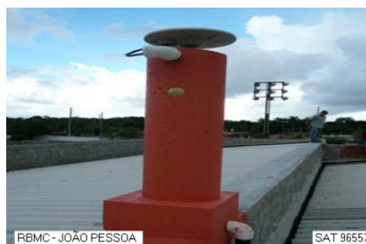
Antena e pilar