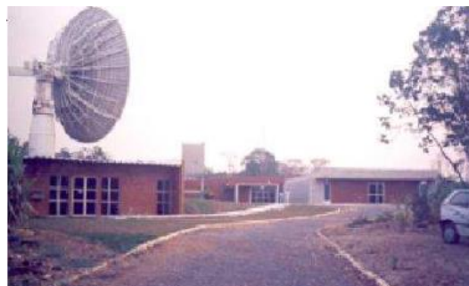
Antena e pilar